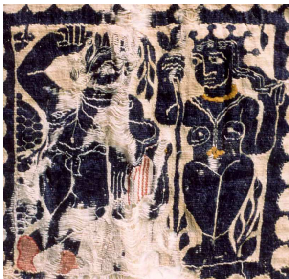
Anonyme, Carré avec Apollon et Daphné (détail), Tissu copte, coll. IMA