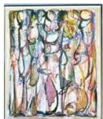
5. Paul Guiragossian (1926-1993) La longue marche, 1982 Huile sur toile Inv. AC 87-41 Paris, coll. Musée de l'IMA