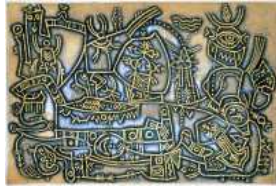
8. Mustapha Fathi Composition , 1984 Gravure Inv. AC 86-51 Paris, coll. Musée de l'IMA