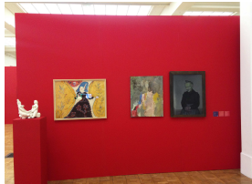
10. Vue de l'exposition DES AFFINITES ELECTIVES De g. à d. : oeuvres de Baya, Eugène Leroy, Jean Fautrier