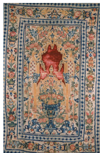
3. Anonyme Tapis de prière Banaluka, XVIIIe s. Velours, feutre et fils de soie Provenance Balkans ou Turquie Inv. AI 88-59 Paris, coll. Musée de l'IMA Don Christian Kircher