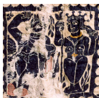
1. Anonyme Carré avec Apollon et Daphné Tapisserie de laine sur lin Inv. AI 88-41 Paris, coll. Musée de l'IMA

Merci de bien vouloir reprendre pour chaque utilisation les légendes et crédits suivants :