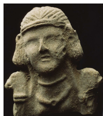
4. Anonyme Tête de figurine, VIIIe-XIIIe s. Stuc moulé Provenance Mossoul, Irak Inv. AC 94-06 – AC 94-07 Paris, coll. Musée de l'IMA