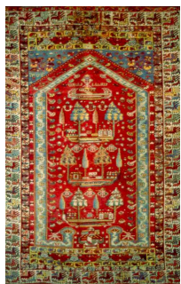
2. Anonyme Tapis de confrérie Turbelik, 1958 Laine Provenance Kircheir, Turquie Inv. AC 87-65 Paris, coll. Musée de l'IMA