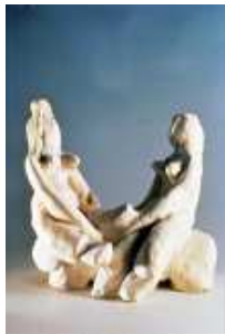
9. Baya Deux femmes à la bête , 1958 Céramique Inv. AC 87-71 Paris, coll. Musée de l'IMA