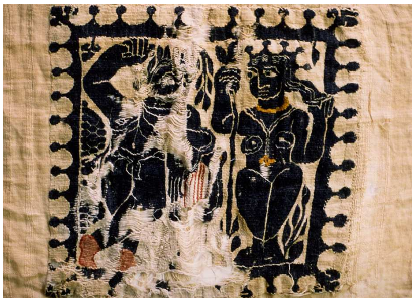
Anonyme, Carré avec Apollon et Daphné (détail), Tissu copte, coll. IMA

COMMISSARIAT EVELYNE-DOROTHEE ALLEMAND | YANNICK COURBES