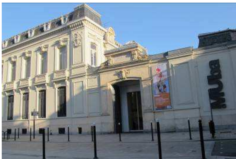
Façade du MUba Eugène Leroy

Ainsi, tantôt l'accrochage s'édifie dans l'esprit du white cube, laissant à l'œuvre, aux œuvres, leurs respirations, laissant aussi aux regardeurs le temps et la place à la contemplation, et tantôt il s'édifie dans l'esprit du cabinet de curiosité, il offre donc une liberté totale des regards, ce denier allant, navigant, se perdant dans l'accrochage et son désordre apparent. Cette espace comme l'atelier est un espace de « bricolage », terme cher à Levi Strauss, un espace qui a la capacité de transformer l'existant, de le construire symboliquement et visuellement avec les simples matériaux qui l'entourent.