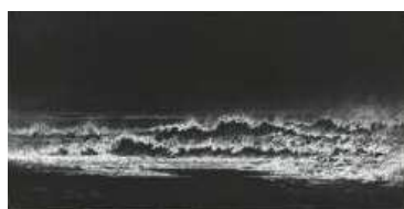
Aji V.N Sans titre 2008 Fusain sur papier

univers dépassant le réel. Ils ont été jusqu'à imaginer des ciels, des nuages, des sites, des architectures, des perspectives insolites et tenant du prodige. Quelles villes bâtissent un Carpaccio ou un Memling pour y promener sainte Ursule, et quelle Tarse édifie Claude Lorrain pour sa petite Cléopâtre ! Quelles vallées creusées dans le saphir ouvrent les peintres lombards ! Enfin, partout, aux murs des musées, que de fenêtres ouvertes sur des mondes artificiels qui semblent taillés dans le marbre et l'or et sur des espaces nécessairement chimériques ! » Gustave MOREAU. Le monde fantastique intérieur est une source de l'oeuvre de Tinus Vermeersch . En effet, il donne à découvrir un univers emprunt d'images mystérieuses et oniriques où l'animal se mêle au végétal et au minéral rappelant parfois l'oeuvre de Jérôme Bosch ou de Peter Brueghel. " J'aime voir mon travail comme des fragments et des allusions aux temps épiques perdus, et aux sociétés vernaculaires, comme des parties ou des détails déchirés d'un plus grand contexte ", explique l'artiste. A travers ce travail de cataloguage, tel un collectionneur ou un archéologue, Tinus Vermeersch crée et inventorie un monde habité par des formes hybrides mi chevelure, coque ou plumage d'oiseau, utilisant autant les techniques ancestrales telle que la tempéra, l'encre de chine ou bien encore le plâtre.