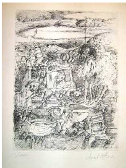
Roel d'Haese Sans titre 1962 Plume sur papier

A travers la découverte du "cadavre exquis" en littérature et en arts plastiques, on pourra explorer le dessin aléatoire, nommer et définir les différents outils et techniques du dessin utilisés par les artistes surréalistes, et expérimenter la pratique du dessin automatique.