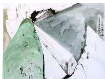
Ronald Cornelissen Boot Hill 2005 Encre, aquarelle sur papier

Depuis 1988, Ronald Cornelissen réalise des dessins, sculptures et installations qui mettent en avant la relation entre l'homme et son environnement immédiat et les frictions qui en résultent. Il parle en quelques mots de son thème de prédilection: « La ville, avec son architecture qui peut parfois être intimidante et impersonnelle, ainsi que l'invasion toujours grandissante de notre espace vital, est un thème important dans mon travail ». L'artiste utilise comme source d'inspiration, la culture urbaine des comics,