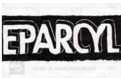
Julien Baete BHV XCII. 2009

Le dessin procède aussi de l'ennui : une vacuité du corps (mais pas de la main, toujours remuante elle), mais une disponibilité de l'âme. De ses attentes riches, l'évasion est rendue possible en voyages mentaux et en divagations éventuelles.