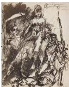
Eugène Leroy Sans titre vers 1950 Plume et encre de Chine

multitude de réseaux, grilles et plans autant de vibrations, pulsions et rythmes témoins de sa présence au monde.