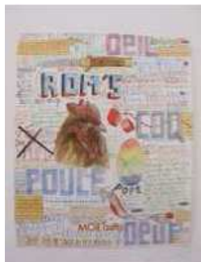
Mon Colonel et Spit Intervention et installation in situ Été et automne 2011

Ainsi l'intervention des artistes Mon Colonel et Spit au sein de l'exposition et du musée prend tout son sens. Ce duo atypique qui partage son activité artistique entre installations, peintures et concerts techno - avec leur groupe Party Harders - a construit, expérimenté et vécu durant deux jours et deux nuits dans leur « installation cabane » au coeur de l'exposition. Expérience totale voire extrémiste du dessin, les deux artistes vivent dans et grâce à leur installation le temps de sa conception et de sa création. Attentifs et sensibles à leur environnement et à leur époque, cet abri de fortune se fait l'image de leur regard parfois moqueur, acide ou cynique sur notre société, le dessin étant à la fois le moyen de l'expérimentation et sa trace.