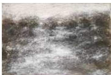
Marc Ronet Paysage 1971 Craies de cire et encres

dense, proche d'hallucinations ». Dans un entretien, Elmar Trenkwalder déclare : « Je me sens comme une sorte "d'aspirateur" des images et des émotions du monde. Je transforme ces images et ces émotions, comme dans le travail du rêve. Je peux utiliser le souvenir précis d'un objet ou d'un paysage, mais il m'arrive parfois de peindre ou de construire un paysage qui n'existe pas, que je n'ai jamais vu, mais qui cependant semble très connu [...] J'essaye de retrouver les chemins de ces images. Ce qui n'est pas simple, car tout se passe comme dans un tunnel. ». Les dessins présentés ici sont autant d'esquisses, d'essais ou de fantaisies sortis tout droit de l'imaginaire de l'artiste, un monde où symbolique sexuelle, métaphore et allégories sont indéfectiblement liées à l'architecture. Un monde où la nature et les hommes se muent en éléments architecturaux et vice-versa, et où les éléments décoratifs deviennent des figures érotiques et sexuelles.