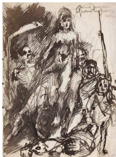
Eugène Leroy Sans titre vers 1950 Plume et encre de Chine sur papier