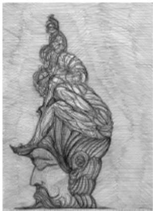
Elmar Trenkwalder WVZ 767 1994 Crayons sur papier

dense, proche d'hallucinations ». Dans un entretien, Elmar Trenkwalder déclare : « Je me sens comme une sorte "d'aspirateur" des images et des émotions du monde. Je transforme ces images et ces émotions, comme dans le travail du rêve. Je peux utiliser le souvenir précis d'un objet ou d'un paysage, mais il m'arrive parfois de peindre ou de construire un paysage qui n'existe pas, que je n'ai jamais vu, mais qui cependant semble très connu [...] J'essaye de retrouver les chemins de ces images. Ce qui n'est pas simple, car tout se passe comme dans un tunnel. ». Les dessins présentés ici sont autant d'esquisses, d'essais ou de fantaisies sortis tout droit de l'imaginaire de l'artiste, un monde où symbolique sexuelle, métaphore et allégories sont indéfectiblement liées à l'architecture. Un monde où la nature et les hommes se muent en éléments architecturaux et vice-versa, et où les éléments décoratifs deviennent des figures érotiques et sexuelles.